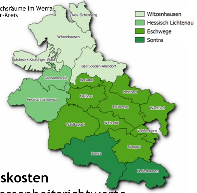
Vergleichsräume im Werra-Meißner-Kreis